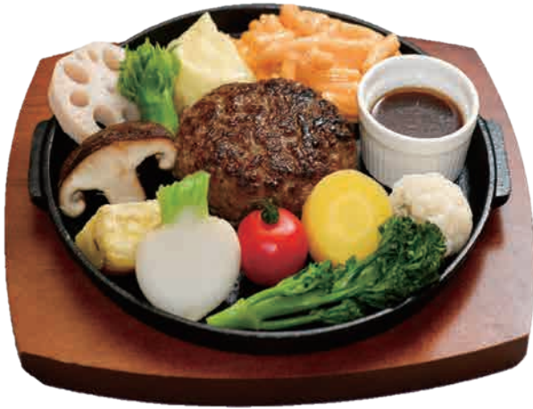
黒毛和牛ハンバーグ (ライス・スープ付き)