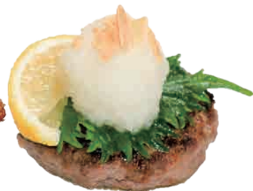
大根おろしポン酢 + ¥ 200