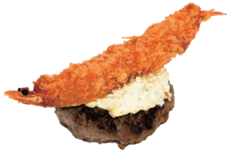
タルタル海老フライ + ¥ 400