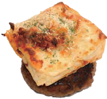
ラザニア + ¥ 400