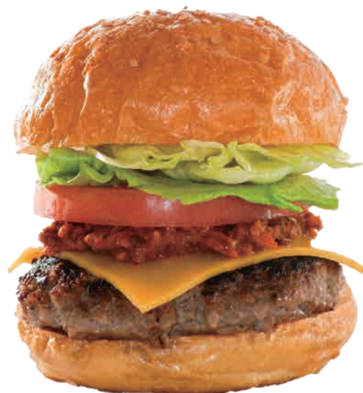
黒毛和牛ハンバーガー