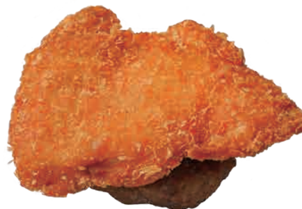
フライドチキン + ¥ 300