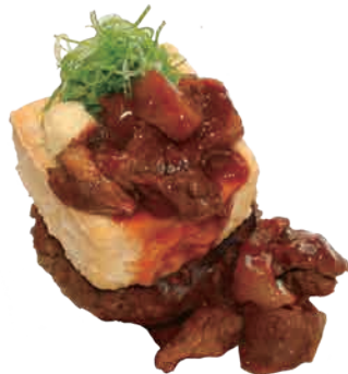
自家製厚揚げぼっかけ + ¥ 500