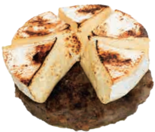
焼きカマンベール + ¥ 600