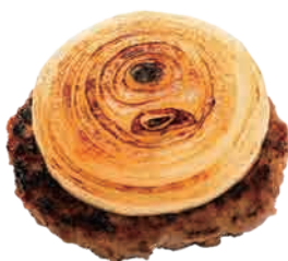
ローストオニオン