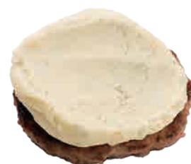
ゴルゴンゾーラ マッシュポテト