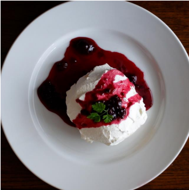
メレンゲのケーキ ～ベリーソース～

焼いたメレンゲの上にたっぷりのクリームとフルーツをのせたデコレーションが目目を引く、ニュージーランドの定番ケーキ。メレンゲの外側はサクツとして中はマシュマロのように口の中でシュワッと溶ける、他のケーキにはない食感です。