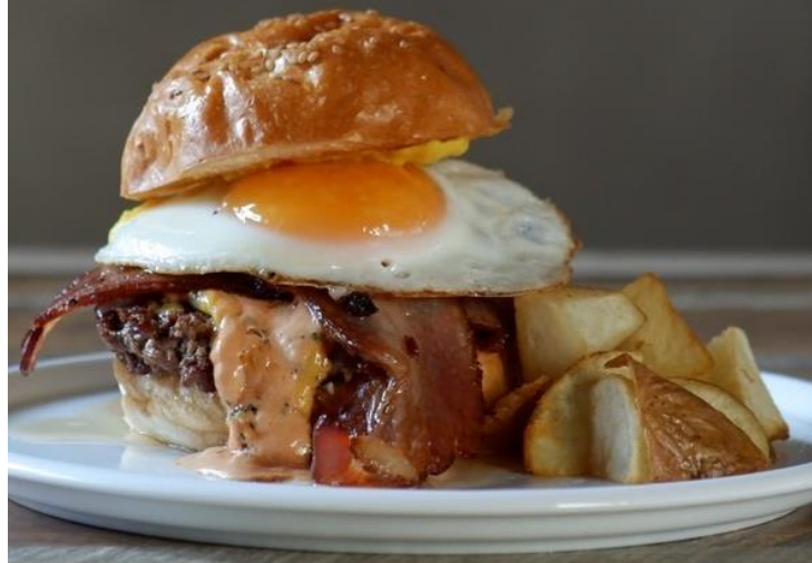
HUNNY BACON EGG BURGER